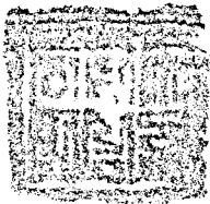
( 구 )