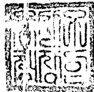
( 신 )